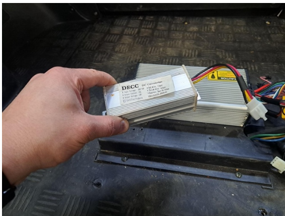
Ota muunnin pois.

Uuden osan asennus käänteisessä järjestyksessä.