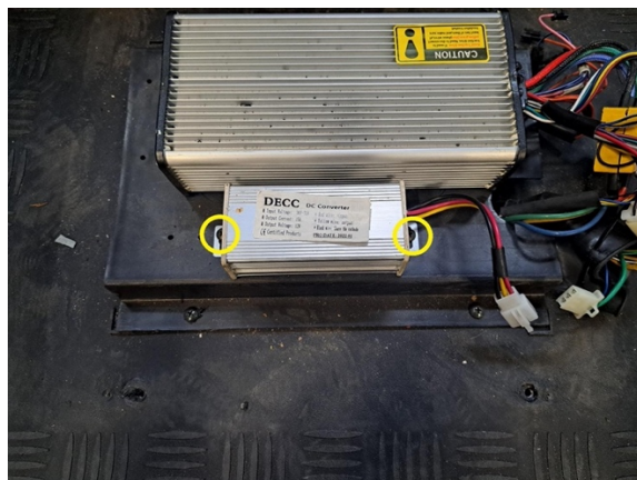
Irrota muuntimen kiinnitysruuvit. (ristipäämeisseli ph2).